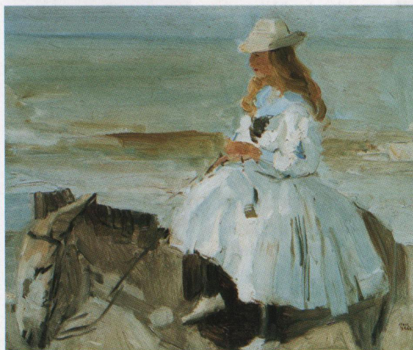
afb. 9: I.L. Israëls (1865-1934), Ezeltje rijden , olie/board 46,1 x 56,1 cm, gesigineerd