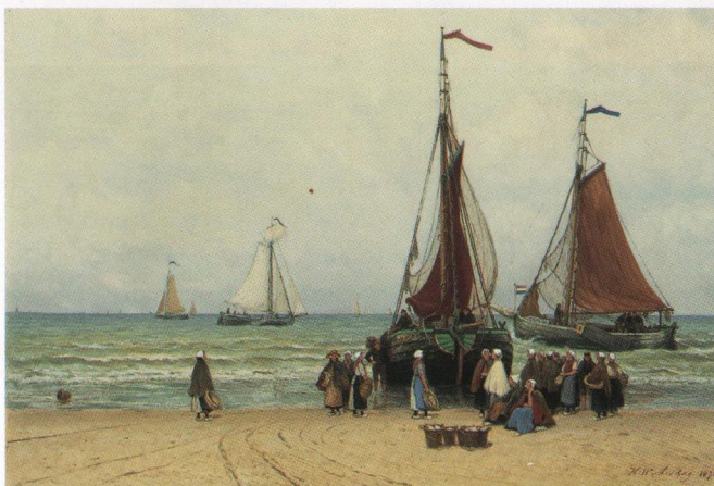
afb. 2: H.W. Mesdag (1831-1915), Bomschuiten en vissersvolk op het Scheveningse strand , olie/doek 69,5 x 88,3 cm, gesigneerd en gedateerd 1872