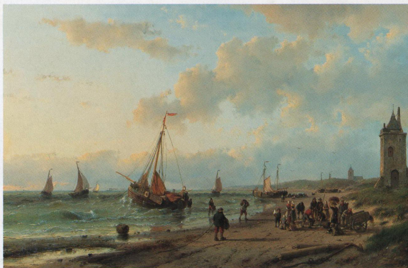
afb. 5: A. Schelfhout (1787-1870), Visafslag op het strand , olie/paneel 44,3 x 63,5 cm, gesigneerd en gedateerd '58