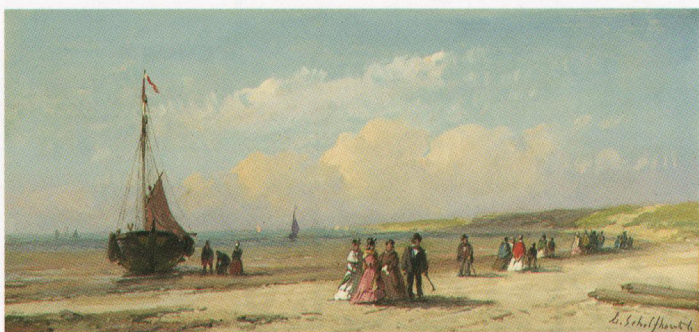
afb. 6: A. Schelfhout (1787-1870), Strandgezicht met wandelende elegante figuren, olie/paneel 10,3 x 21,6 cm, gesigneerd